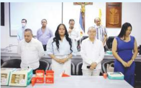
El Concejo realizó un homenaje especial a un grupo de empresarios de Valledupar: Pasabocas Don Modesto, Centro Educativo de Sistemas UPARSISTEM, El Argonero S.A.S., Industrias Negle S.A.S., Frutopping, Costeñitos Valledupar S.A.S.