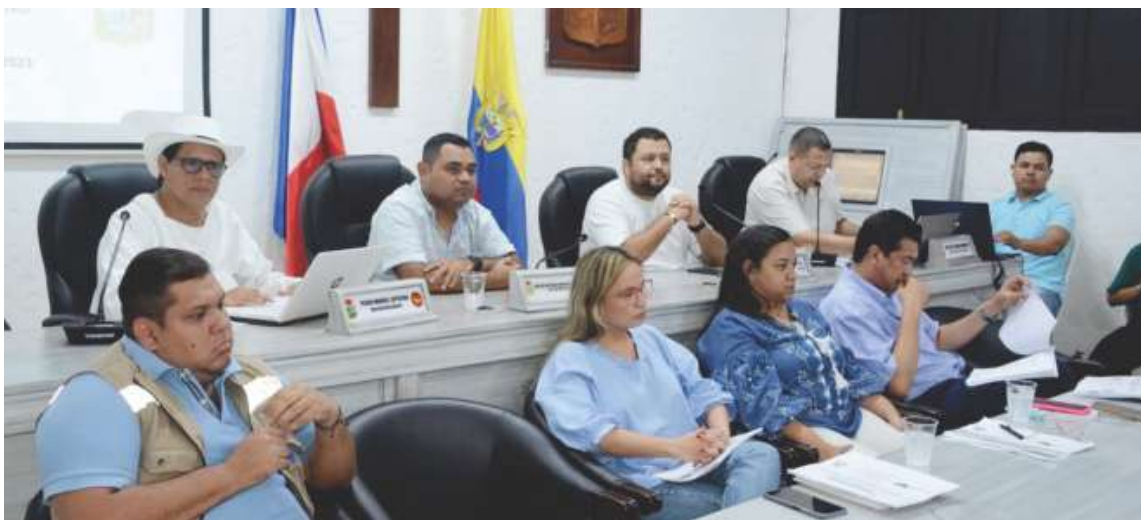
El Concejo de Valledupar realizó importantes debates de control político en la vigencia 2023